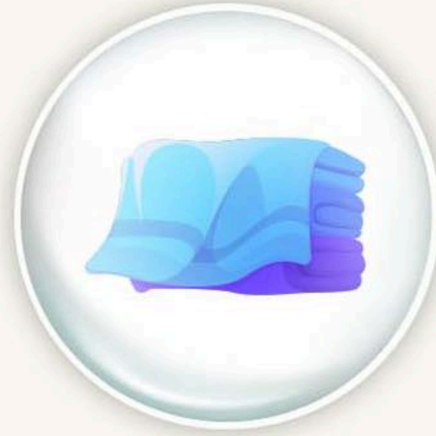
၂. San seng ai sumpan