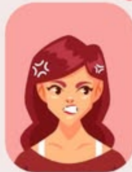
Myit kahta na