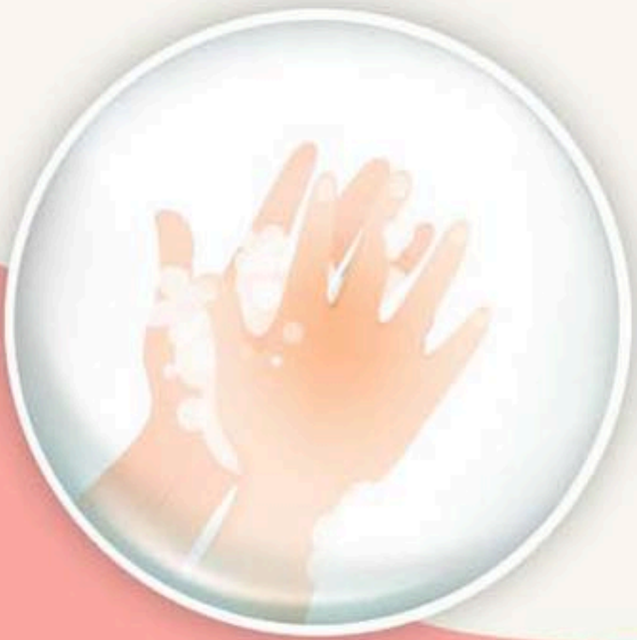
၃. Lata hpe kashin ga