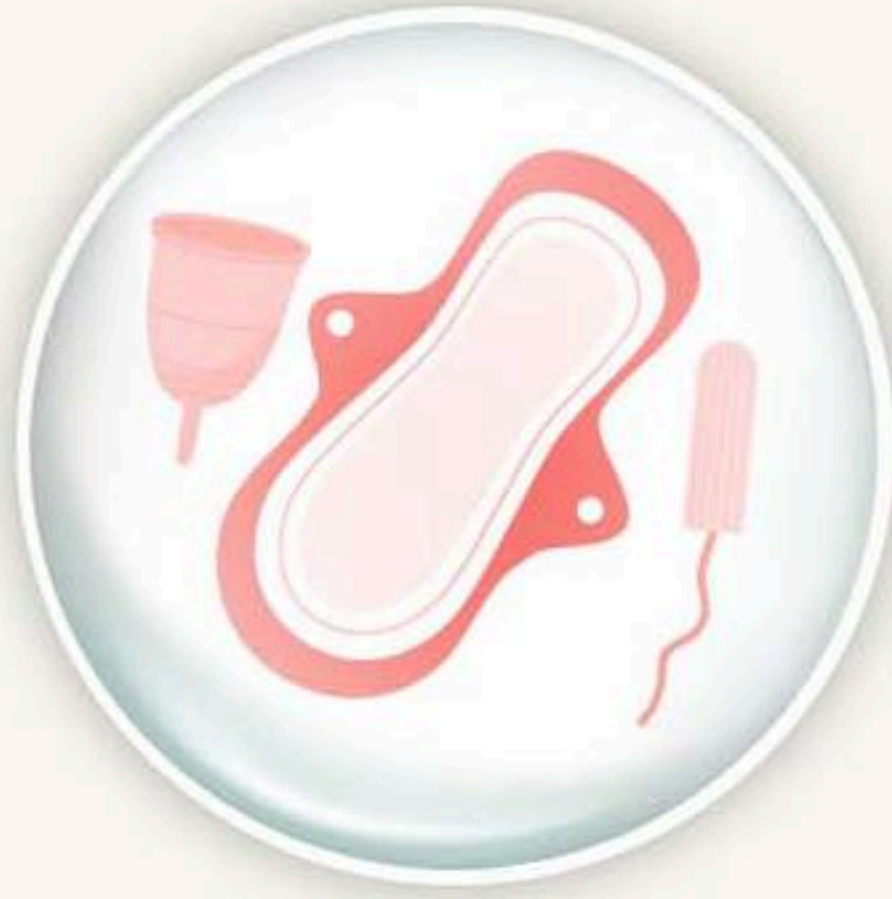
၁. Hking sa ai ten lang ai arai ni.