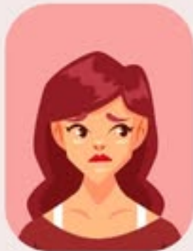
Myit ra ai hku n byin na