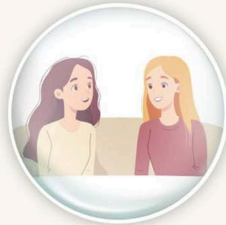
၄. Shim ai shara kaw tsun ga.