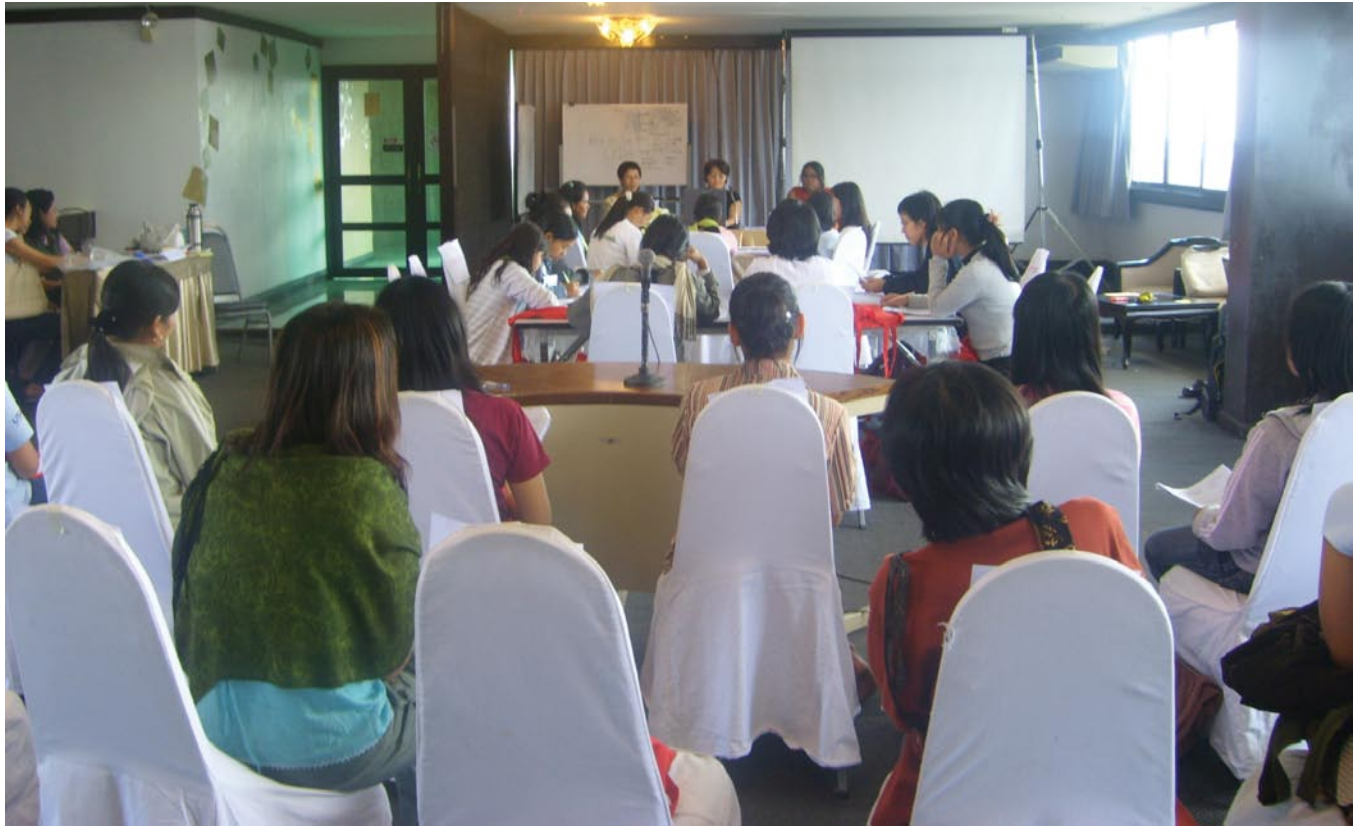
စာချုပ်အဖွဲ့ဝင်နိုင်ငံအား စစ်ဆေးပုံကို လေ့ကျင့်ခြင်း

၂၀၀၈ ဇန်နဝါရီလတွင် ကျင်းပသော ပထမအကြိမ် တိုင်ပင်ဆွေးနွေးပွဲ