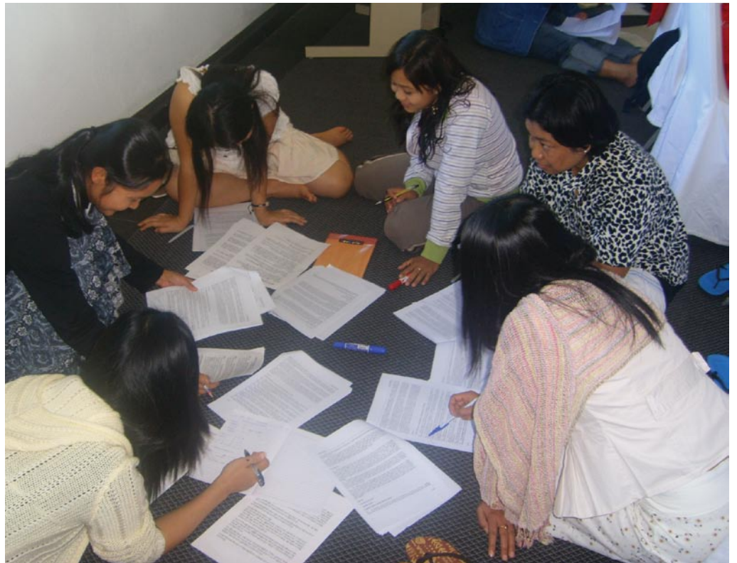
စစ်အစိုးရ၏ အစီရင်ခံစာကို ဖတ်ရှုစစ်ဆေးနေခြင်း